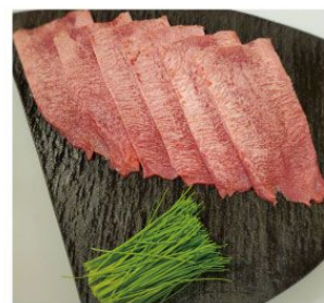
くるくるネギタン (写真は二人前です)